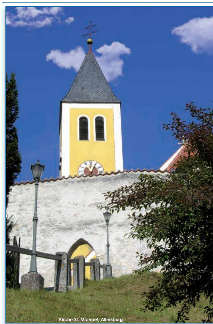
Kirche St. Michael, Allersburg